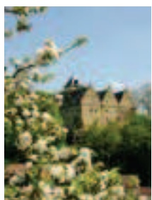
Schloss Mainberg und ...

Sie führt zunächst durch Laubwälder, danach durch die freie Landschaft des Schlettach und schließlich wieder durch den Wald zum Main zurück.